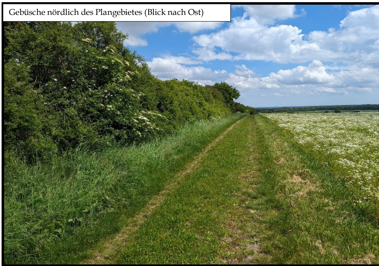
Fotos: Eindrücke aus dem Plangebiet.